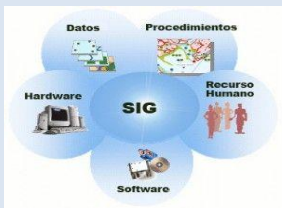
Imagen 1. Marker. (2018). Sistema de información gerencial [imagen] recuperado de https://www.informatica-hoy.com.ar/informatica-tecnologia-empresas/Como-un-sistema-de-informacion-gerencial-mejora-los-procesos-de-las-empresas.php